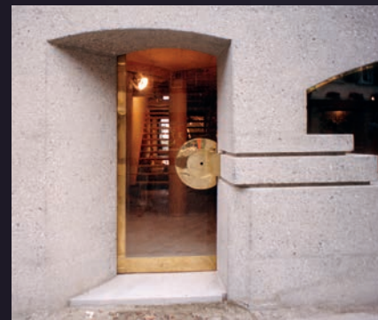
Kunstforum Art gallery „Mandelbaum“ Steckborn – rekonstrukce domu z 18. století