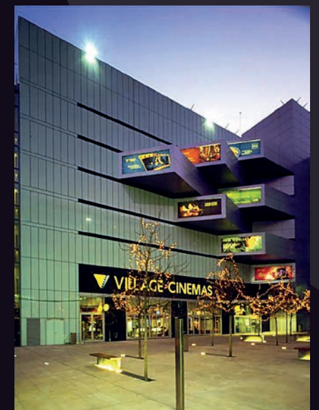
Anděl City – multikino, Praha