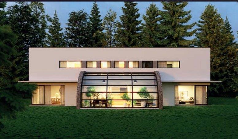
Vila v Plzni