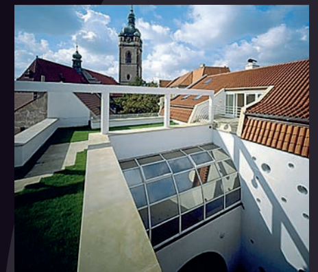
Dům u rytíře, Mělník – rekonstrukce a dostavba budovy z 19. Století