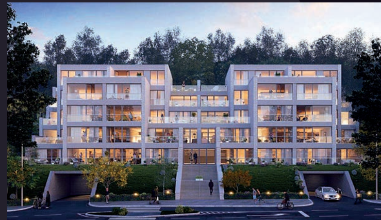
Rezidence Božíňka, Praha Jinonice